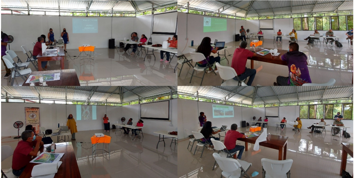
Figura 2. Taller de intercambio de experiencias y cierre de año con viveros de Amazonas, Río Cañas, APROCOME y Boruca, 03 de diciembre 2020.