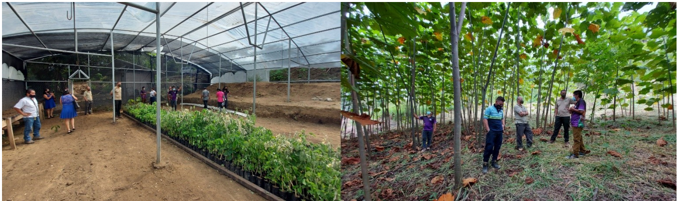
Figura 4. Visita a vivero de Boruca y plantación, 03 de diciembre 2020.