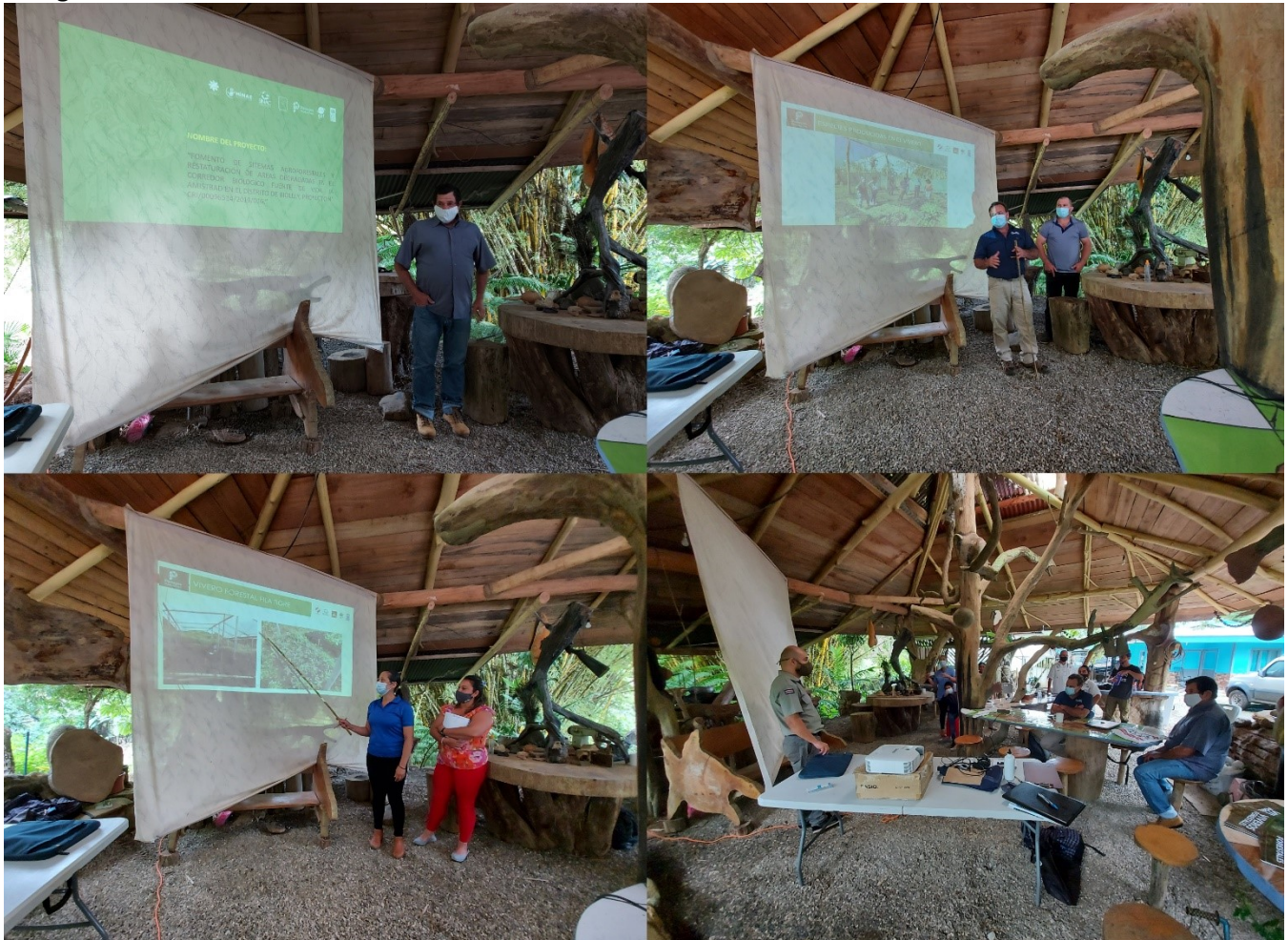
Figura 1. Taller de intercambio de experiencias y cierre de año con viveros de ASOPROLA, ADIALSI, Fila Tigre y la CGIS, 02 de diciembre 2020.