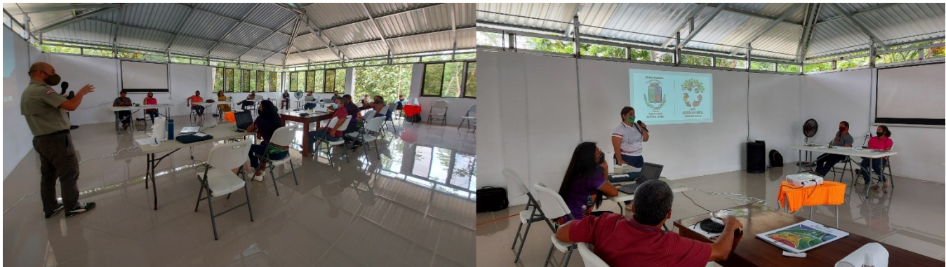
Figura 3. Presentaciones de instituciones invitadas SINAC, Municipalidad de Buenos Aires, Río Cañas, 03 de diciembre 2020.