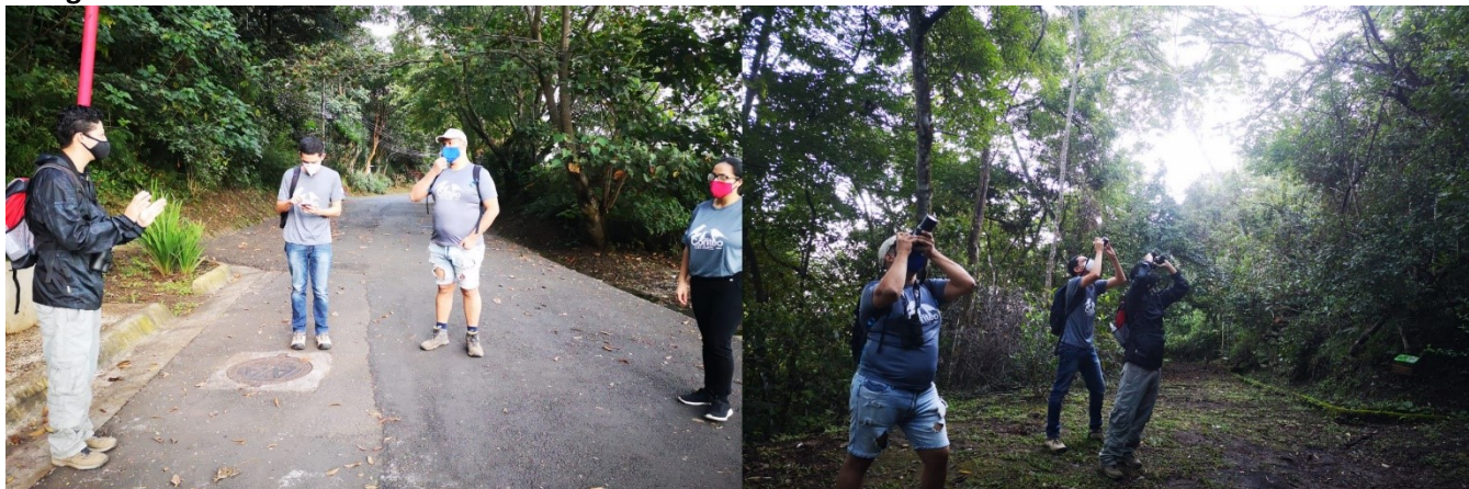
Figura 5. Conteo de aves navideño del CBIMA, 05 de diciembre 2020.